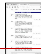
2. Mediciones y presupuesto