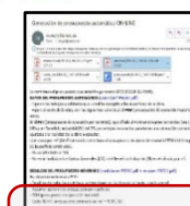
1. Correo con indicaciones