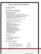
4. Datos de las opciones elegidas